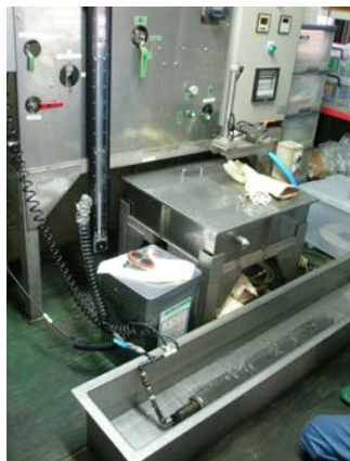
バブルポイント試験